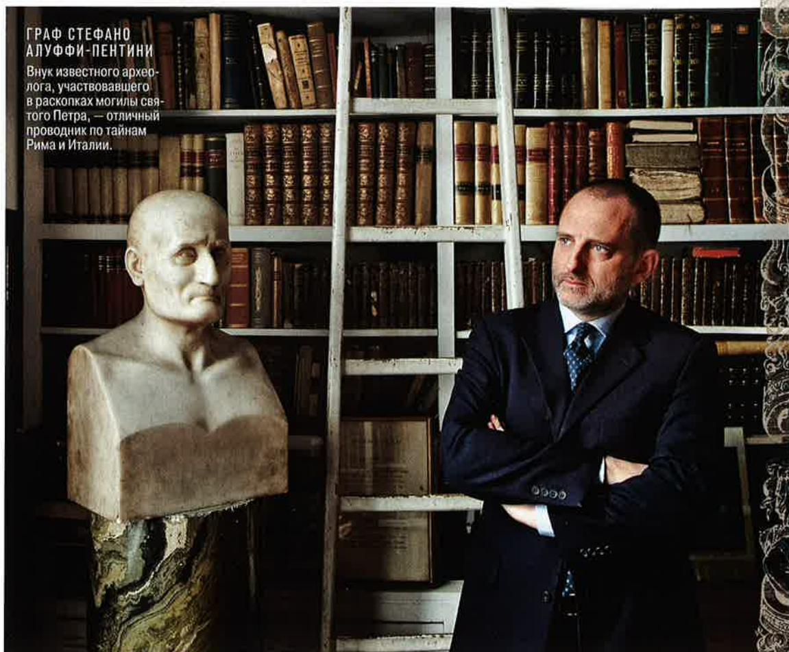
ГРАФ СТЕФАНО АЛУФФИ-ПЕНТИНИ

материальных, неоспоримых доказательств своего присутствия. Здесь и Цезаря. Здесь сожгли его, здесь похоронен Август, здесь и апостола Петра. Я был там, и вот он я... — словно наличие картинке делает ваше присутствие более реальным, соли и вам толику бессмертия. Жизнь о Риме сложно. О нем настолько неподражаемо прелего, что ты неизбежно чувствуешь ничтожество. Я не хотел говорить о Риме ни слова. И мало-откладывал эту статью, словенный разговор, к которому не Парадоксально, но за десять лет вования GQ в России мы успели написать о глухих местах в Тибете-Шри-Ланке, а о Риме — почти И даже теперь я успокаиваю, что моя статья не про Рим, римлян, в сущности, про те же го и я. Мы скользим по истории вещей. Мы есть, и нас уже авда, римляне, о которых